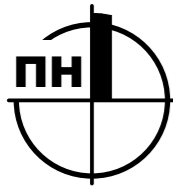
Схема розташування земельної ділянки у планувальній структурі території територіальної громади